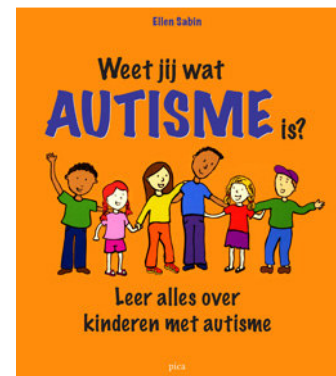
Boek van Ellen Sabin, geschreven voor kinderen van 8 jaar

Bovendien is er een schrikbarende toename van kinderen in het autistisch spectrum. Hierbij gaat het om kinderen die óf echt autistisch zijn, of wat vaker voorkomt om kinderen die een aantal kenmerken vertonen van autisme, maar toch niet helemaal autistisch zijn. Dit wordt dan een 'aan autisme verwante aandoening' genoemd.